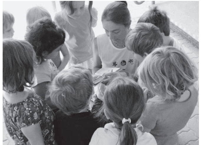
„Welche der Schnalben im Buch sieht nun genauso aus wie die auf dem Bewegungsmelder?“