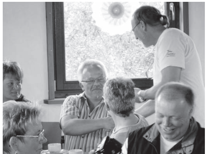
Freudige Stimmung herrscht bei der Übergabe der Plaketten für das „Schnalbenfreundliche Haus“ auf dem Birkenhof in Wilnsdorf-Wilgersdorf“

In der nächsten Ausgabe der „Natur und Umwelt“, wenn das Projekt abgeschlossen ist, gibt es einen ausführlicheren Bericht zum „Hilchenbacher Schnalbensommer 2010“.