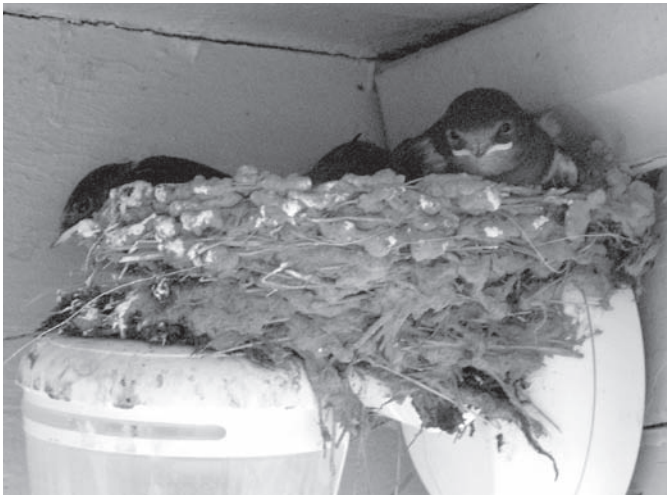
Im Kindergarten Ostbelden brütet ein Rauchschnalbenpärchen auf dem Bewegungsmelder ...