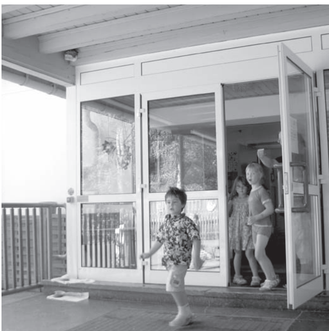
... direkt im Eingangsbereich des Kindergartens, im Bild oben links.