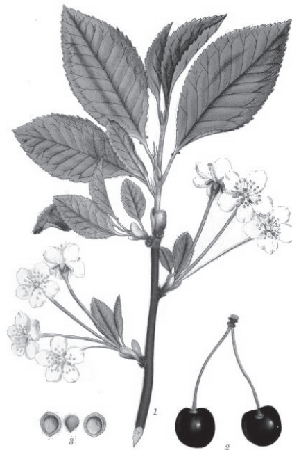
FÄGELBÄR, PRUNUS AVIUM L.

weiße Blütenkronblätter. Nach der kurzen Blütezeit von einer Woche fallen somit fünf Millionen Blütenblätter vom Baum herab.