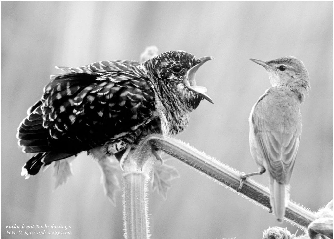
Kuckuck mit Teichbrohrsänger