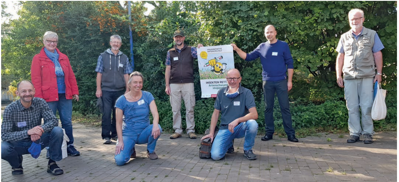
Die Delegierten aus Siegen-Wittgenstein zur Landesvertreterversammlung des NABU NRW unterstützen die Volksinitiative.

Stimme verleihen. Um die Forderungen des Bündnisses in den Landtag zu bringen, werden in NRW Unterschriften von 0,5% der Stimmberechtigten benötigt - das sind rund 66.000. Das Magazin „Naturschutz in NRW“, eingehftet in das Mitglieder magazin des NABU Bundesverbands „Naturschutz heute“ hat bereits ausführlich berichtet.