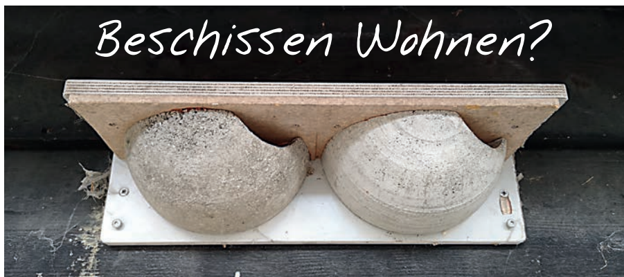
Mehlschwalben-Kunstnest dunkler Hintergrund ↑ Mehlschwalben-Kunstnest heller Hintergrund und „Kotspritzer“ ↓