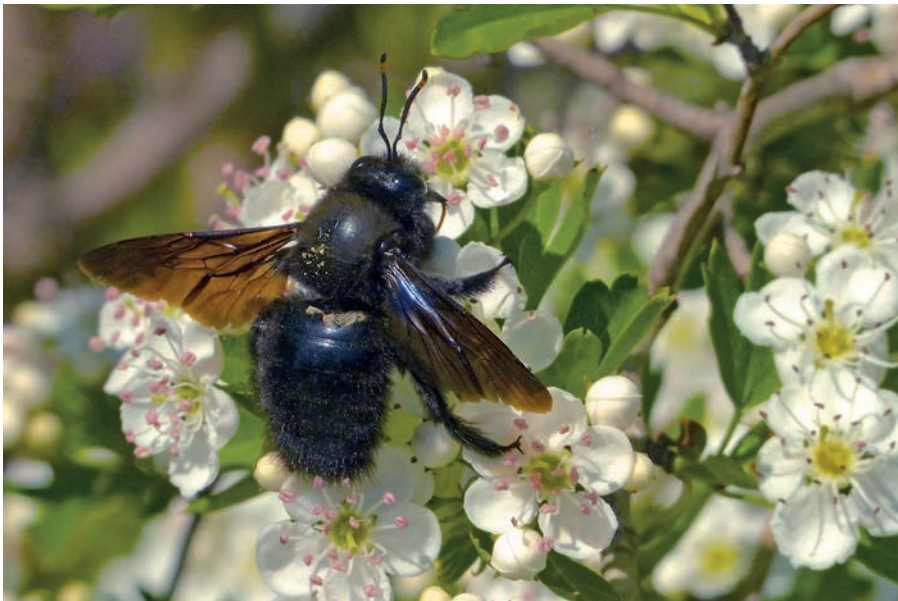
Die Blauschwarze Holzbiene ist so groß wie eine Hummelkönigin und dürfte im gesamten Siegerland zu erwarten sein.