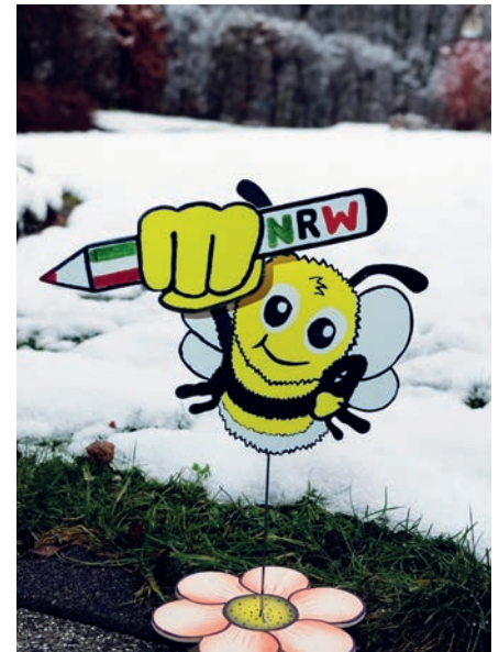
Das Maskottchen, beweglich bei Wind und durch Anstupsen, wird bei den Aktionen zum Blickfang.

Dies war Anlass für die drei Naturschutzverbände BUND, NABU und LNU in NRW Ende Juli 2020 gemeinsam die Volksinitiative Artenvielfalt NRW zu starten. In acht Themenfeldern - von der Reduzierung des Flächenverbrauchs, über die Förderung einer naturverträglichen Landwirtschaft und der Stärkung des Biotopverbundes bis zum Schutz von naturnahen Wäldern und lebendigen Gewässern - formulierten die Naturschutzverbände Forderungen und konkrete Handlungsvorschläge. Unter dem Motto „Insekten retten - Artenschwund stoppen“ können Bürger*innen mit ihrer Unterschrift der Artenvielfalt in NRW eine