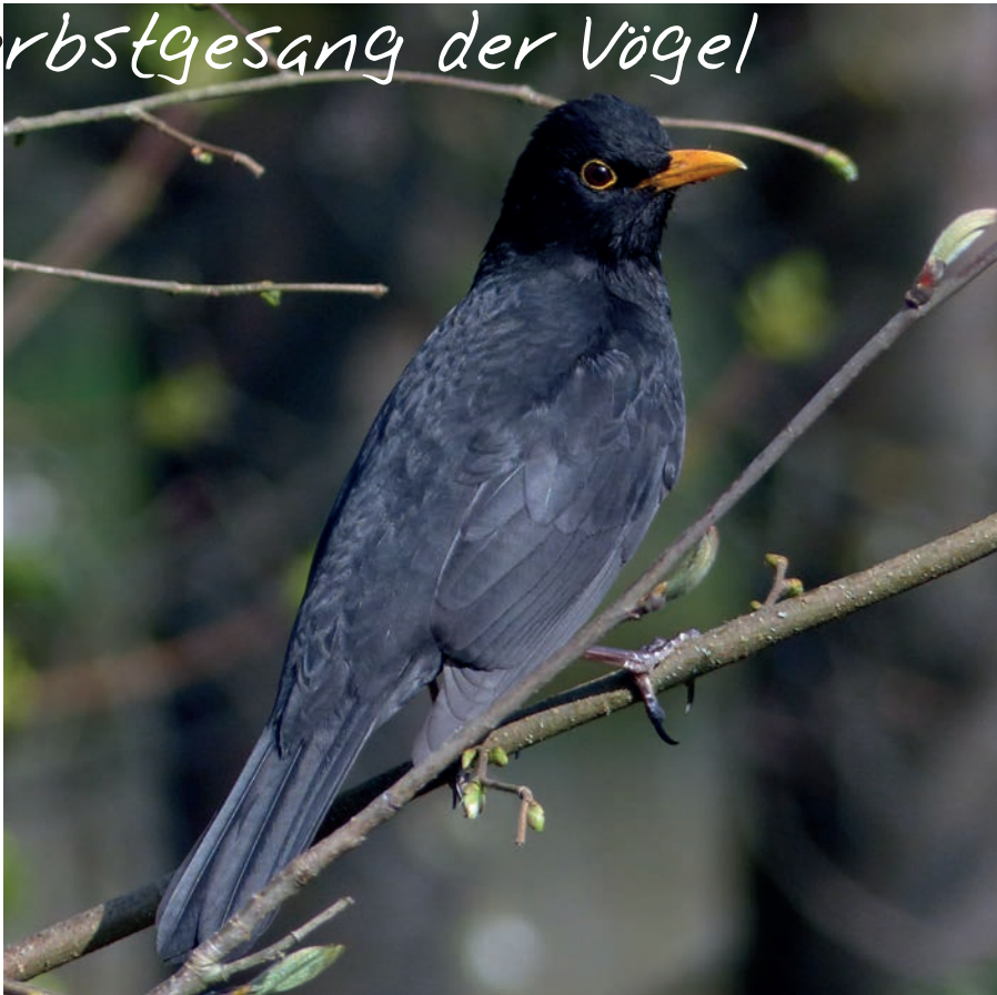
Amseln singen nahezu das gesamte Jahr und zeigen sich am Futterplatz im Winter gegenüber Artgenossen aggressiv.

Doch zurück zum Vogelgesang, der allgemein gesagt vor allem zu Beginn des Fortpflanzungszyklus im Frühjahr bei uns die stärkste Aktivität erreicht und durch aufeinanderfolgende Brutzyklen im Verlauf des Frühjahres bis in den Sommer hinein mehrere Gipfel haben kann. Genaue Informationen für unsere Region finden sich zu diesen Reviergesängen im unserem neuen Band „Die Vögel des Siegerlandes“ (SARTOR