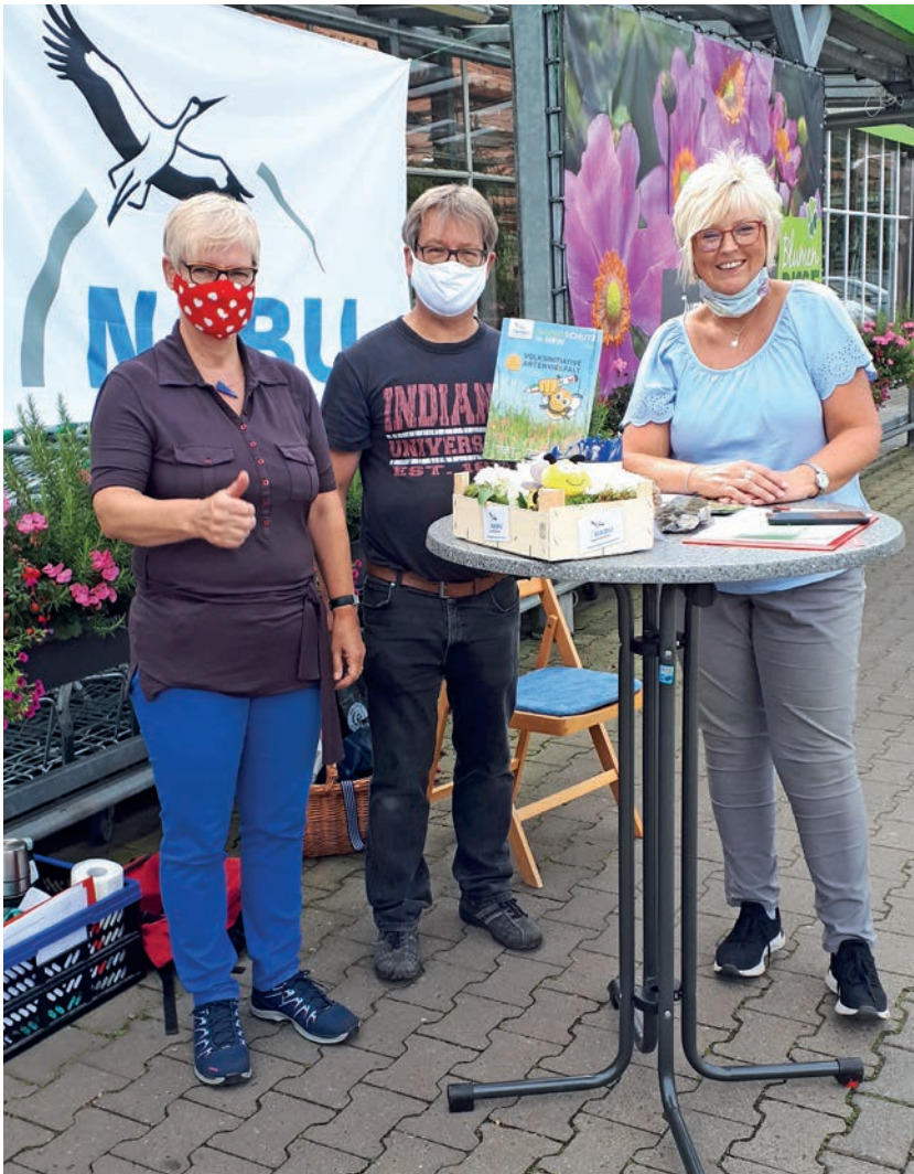
Info-Stände zur Volksinitiative vor Blumen Risse in Buschhütten ... ... und bei den Klimawelten in Hilchenbach.