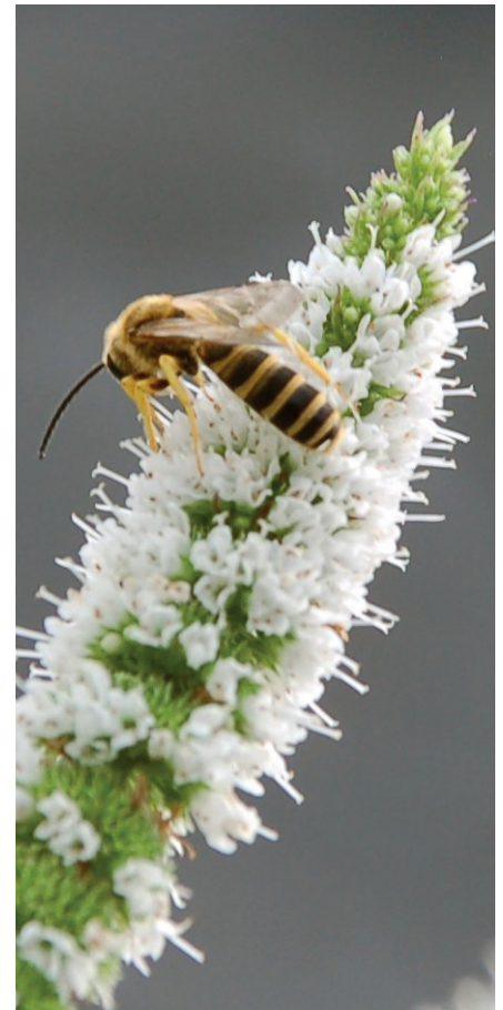
Gelbbindige Furchenbiene - neu im Kreis Siegen-Wittgenstein.

Zuletzt noch zum überfälligen Neuzugang der Gelbbindigen Furchenbiene ( Halictus scabiosae ). Von dieser Art veröffentlichte Kerstin Schrejma in der letzten NuU ein Foto eines Männchen vom Giersberg. Die Art breitet sich seit Jahren stark aus und konnte dieses Jahr auch schon in Kreuztal festgestellt werden. Vor etwa vier Jahren tauchte die Art bereits in Freusburg auf. Am Edersee ist sie